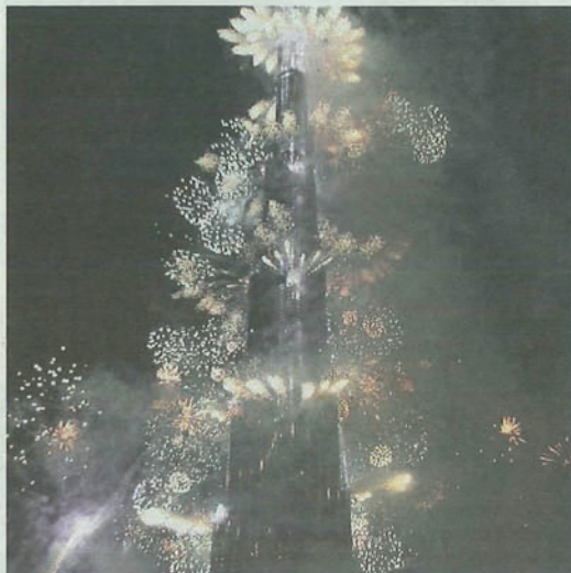
I festeggiamenti ieri notte per l'inaugurazione del Burj Dubai

IL BURJ DUBAI SCEGLIE IL «MADE IN ITALY». Sarà inaugurato