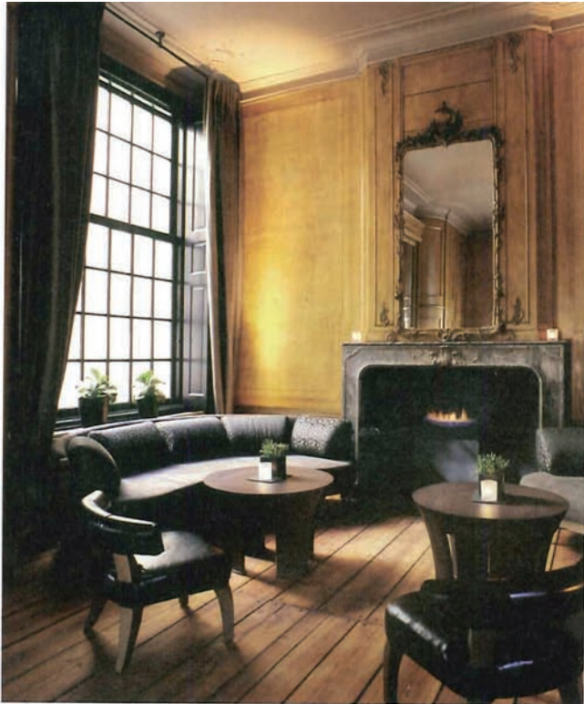
INTERNA, Mary Design FG stijl

From the Anglodutch collection comes the Mary armchair used in the lounge of the Dutch hotel The Dylan (pictured here). Available in two sizes, Mary's point of strength is the unique combination of soft fabric or leather upholstery and the primitive form of the arched legs, which vaguely recall elephant tusks. The frame materials include mahogany, American walnut and greyed beechwood