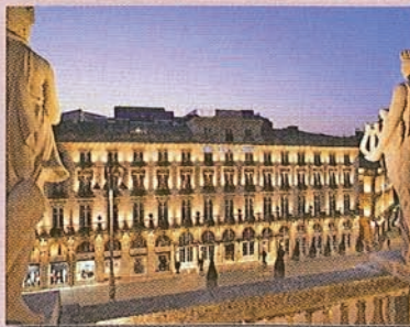
Il Grand Hotel de Bordeaux