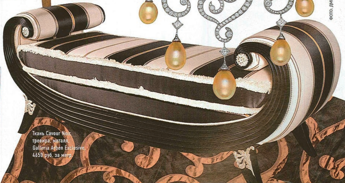
Ткань Savour Noir, тревира, металл, Galleria Argem Exclusive, 4650 руб. за метр.