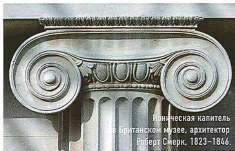
Ионическая капитель Британском музее, архитектор Роберт Смерк, 1823-1846.