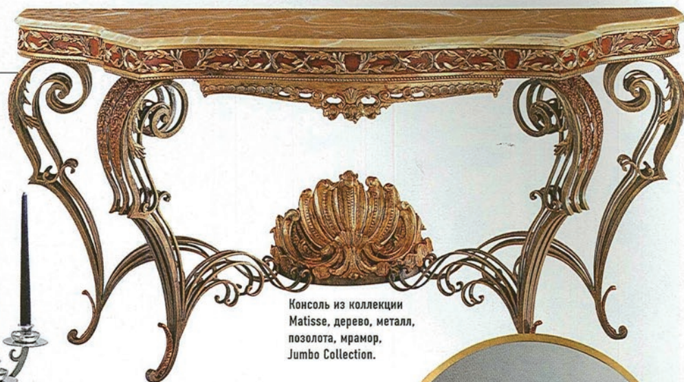
Консоль из коллекции Matisse, дерево, металл, позолота, мрамор, Jumbo Collection.