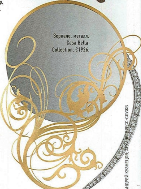
Зеркало, металл, Casa Bella Collection, €1926.