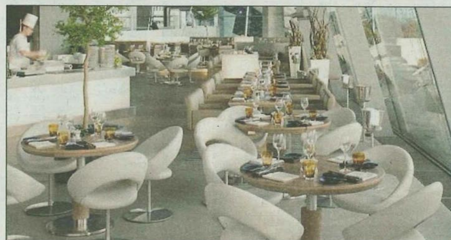
Una veduta interna del Bmw Welt e, sotto, alcuni degli arredi realizzati dal Gruppo Interna di Tavagnacco